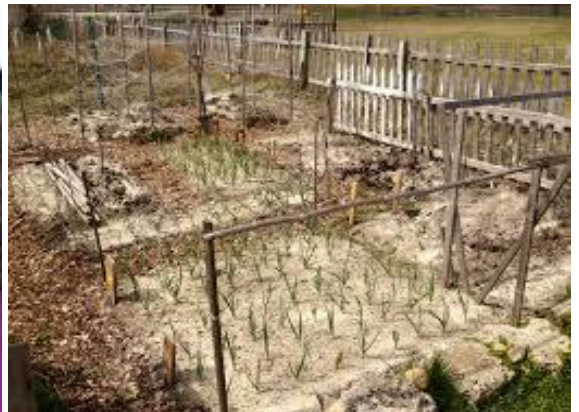
beerihii lagu bacrimiyey