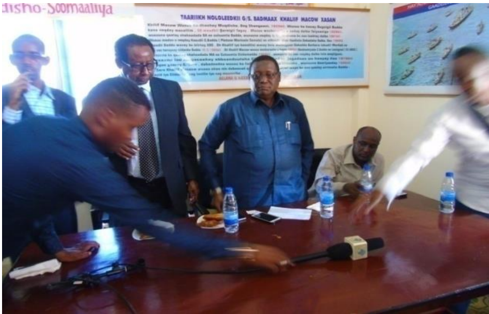
Wasiirka Kalluumaysiga MD Ceymoy iyo Guddoomiyaha Hey'adda C.B.S ADM Faarax Qare ayaa xariga ka jaray Akademiyadda

Akadeemiyaddu waxay ku howlgashaa nidaamka 4ta sano ee Jaamacadaha, Ardayda lagu billaabay labadaan Kulliyadood waxay marayaan Semesterki 3aad, tirada hada wax ka barta Akadeemiyadda waxay kor u dhaafayaan ilaa 100 Arday , waxaana ku baraarujineynaa ardayda ka qalin jebineysa Dugsiyada Sare inay iska diiwaan geliyaan Akadeemiyadda, maadaama ay tahay mid lacag la'aan ah oo loogu tala galay in Bulshada Soomaaliyeed oo dhan ay ka faa'ideysato.