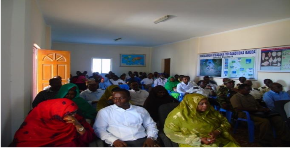
Xafladdii Furintaanka Akadeemiyadda oo ay ka soo qeyb galeen dhammaan qeybaha kala duwan ee Bulshada

Kulliyadaha waa isla Cilmibaarayaasha Hey'adda C.B.S. Sidaas awgeed heerka aqoonto way sarreysaa. Sidoo kale Akadeemiyadda waxay leedahay Dugsi Tababar oo loogu tala galay in lagu tababarro Badleyda Soomaaliyeed ha ahaadeen Kalluumeysato ama dadyowga Xeebaaleyda.