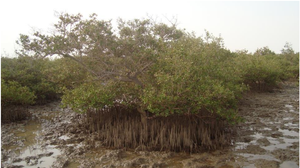
Geedka Mangarroofka ee xeebaha Soomaaliya

Geedka Mangarroofka ah waa geed ku baahsan, xeebaha u dhexeeya labada dhig (Tropical) ee kala ah 25°N-25°S . waana geed ka duwan geedaha kale. Waayo xididadiisa intii ay dhulka hoos ugu quusi lahaayeen waxaay u soo baxaan banaanka. Maangarroofku waa geed faa'iido badan leh oo noole badan soo duma (jiito).