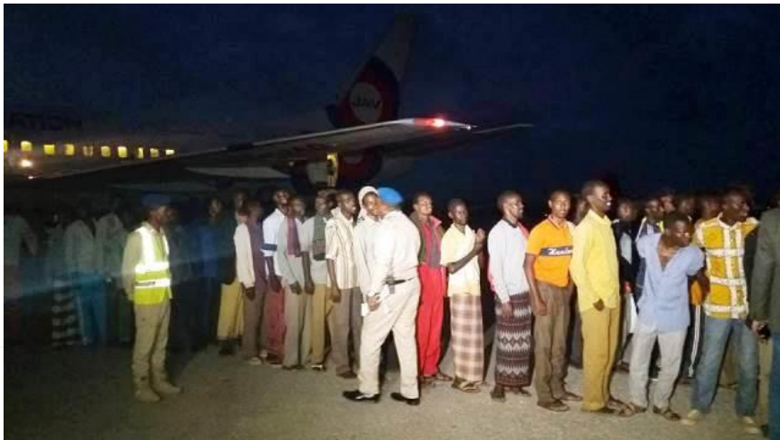
Maxaabiisti oo ka soo degay Garoonka Dayaaradaha Muqdisho

Maxaabiistaan ayaa siideyntooda waxaa ka heshiijiyay dowladaha Soomaaliya iyo Ethiopia iyadoo ay jiraan weli heshiisyo kale oo ay labada dal kala saxiixdeen.