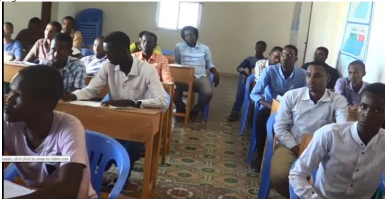
Ardayda Kulliyadda Qaanuunka oo cashar qaadanaya

Waxaa ka howl gala Akadeemiyadda in ka badan 30 (soddon) howl wadeeno oo isugu jira Maamul iyo Macallimiin Jaamiciyiin ah oo (Bachelor, Master iyo PHD) Jamacadaha Dalka iyo Dibadda ka soo qaatay, muddo dheerna ka soo shaqeeyay Sector ka Waxbarashada Dalka.