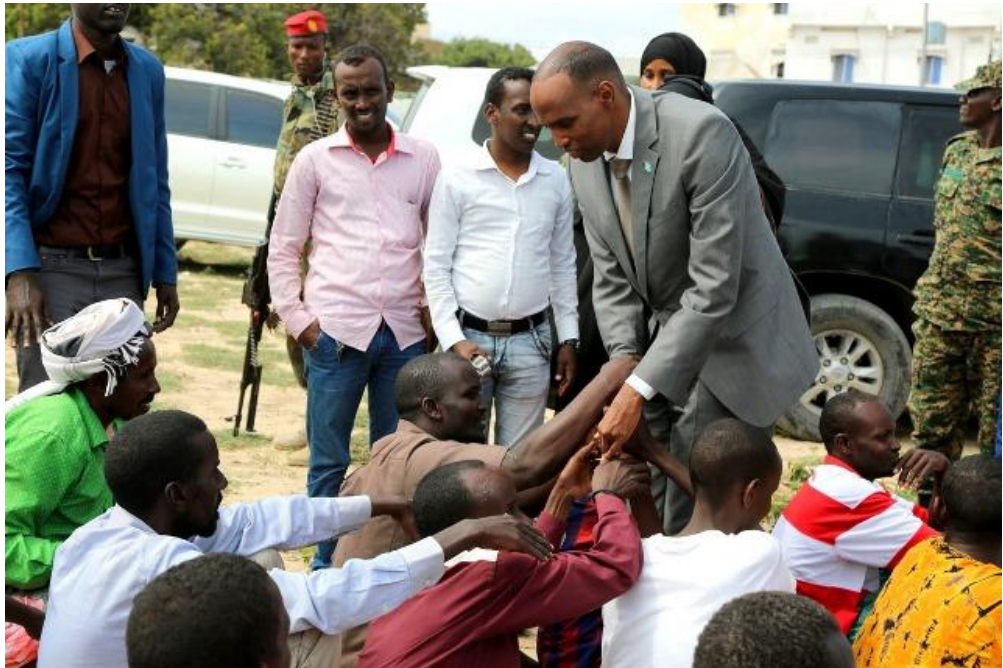
Ra'iisul Wasaare Kheyre oo gacan qaadaya qaar ka mid ah maxaabiista

Ra'iisul Wasaaraha Xukuumadda Federaalka ah ee Soomaaliya Mudane Xasan Cali Khayre oo ay weheliyaan qaar ka mid ah Golahiisa Wasiirada, Xildhibaanno iyo Safiirka Soomaaliya u fadhiya dalka Itoobiya, ayaa booqday 114 dhalinyaro Soomaaliyeed oo ku xirnaa magaalada Jigjiga, ku waasoo dib-uhelay xoriyaddoodii, haatanna ay gacanta ku hayso Dawladda Soomaaliya.