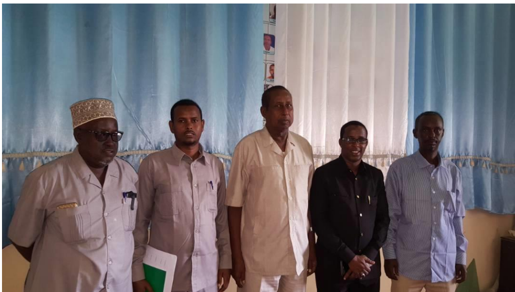
Xubnaha Guddiga Qaranka ee shaqaalaha rayidka iyo Guddoomiyaha Hey'adda

Xubno ka tirsan Guddiga Qaranka ee Shaqaalaha Rayidka ayaa kormeer (Routine) ah ku yimid Xarunta Hey'adda Cilmibaarista, kormeerka guddiga ayaa ahaa mid ay ugu kuurgalaayeen joogista shaqaalaha hey'adda ee xiliyada shaqada.