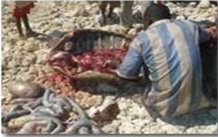
Qubo lagu qalaayo kawaanka Muqdisho