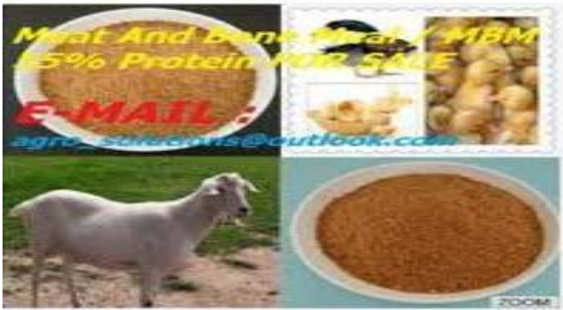
Xoolaha lagu quudiyo

Lafaha Kalluunka waxaa kaloo lagu quudiyaa Bisadaha iyo Eeyaha iyadoo si qasacadeysan loo sameeyo. (3) Sidaas si la mid ah waxaa lagu quudiyaa digaaga loo dhaqdo ukunta awgeed iyo kuwa loo dhaqdo Hilibka.