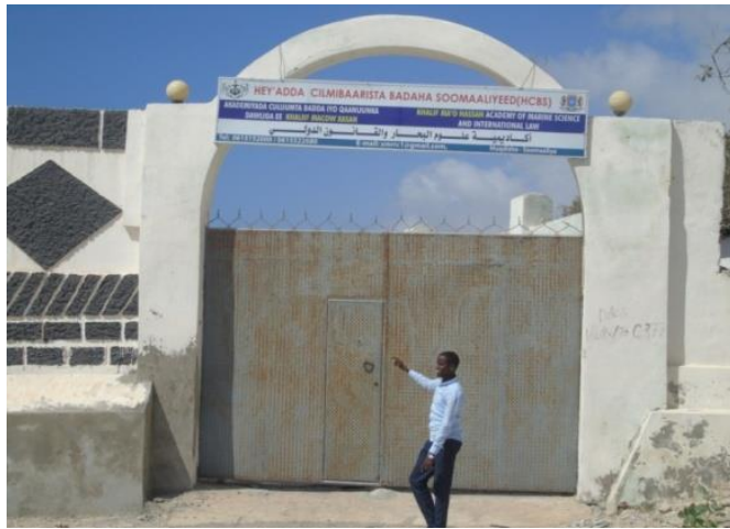
Xaruunta Akadeemiyadda oo ku taal Liido

Hey'adda Cilmibaarista Badaha Soomaaliyeed ayadoo ka ambaqaadeysa waajibaadka loo igmaday ee ah in bulshada Soomaaliyeed ay barto aqoonta badaha, maadaama Soomaaliya ay tahay dal badeed biyuhuna uga wareegsan yihiin 3jiho, waxaa lagama maar maan ah in bulshadu ogaato waxna ka barato aqoonta badaheeda iyo kheyraadka ka buuxa sida looga faa'ideysan lahaa.