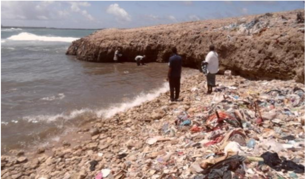
Cilmibaarayaasha Hey'adaa oo qaadaya sample biyaha badda goobta waa (Buurfuule) Xamar weyne

ka hoos maray waxey wax yeeleyn karaan qaab dhismeedka jirka kalluunka, taranka kalluunka, jiritaanka geedaha badda gunteeda ka baxa.