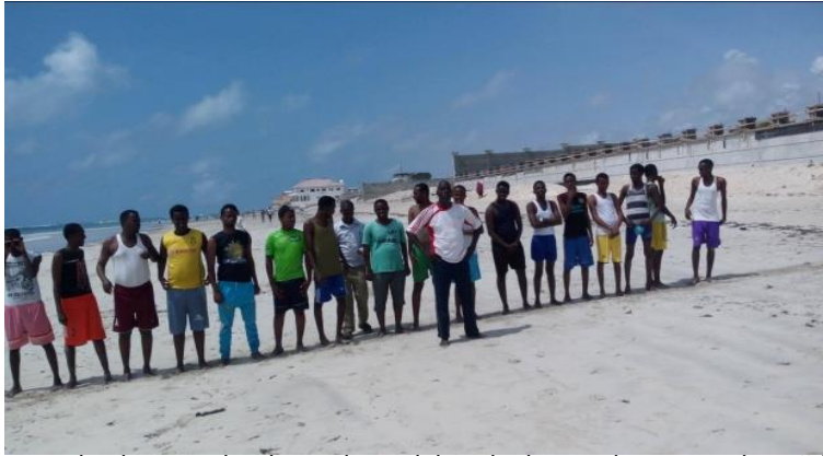
Ardayda oo cashar ku saabsan dabaasha ku qaadanaya Xeebta Liido

Hey'adda C.B.S waxay mar kale baaq u direysaa Shacbi weynaha Soomaaliyeed meel kasto oo ay joogaan inay ka faa'ideystaan Akadeemiyadaan waxna ka bartaan badda baaxadda weyn ee Allah na siiyey, gaar ahaan kuwooda danta yar oo aan awooddin inay Jaamcaadaha lacagta ah iska bixiyaan.