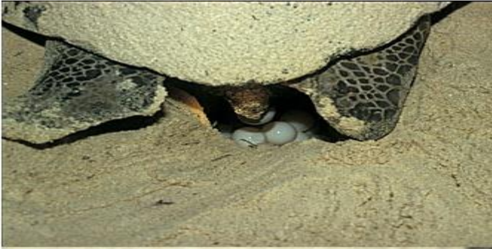
Qubadii oo dhigeysa Ukun Xeebta