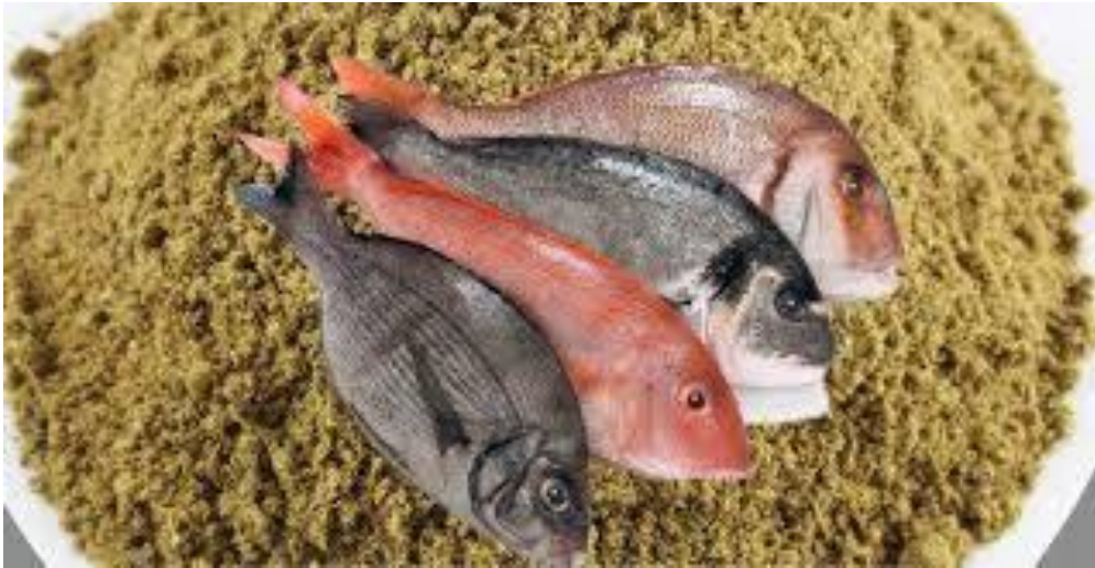
Kalluun Caadi ah iyo Asagoo Shiidan

Sida aynu kor ku soo xusnay lafaha kalluunka waxaa ku badan curiyaasha calciumka (Ca), iyo Zinckiga (Zn) oo waxtar weyn ku leh sameysanka lafaha, sidaas awgeed waxaa lagu daaweyn karaa dadka qaba lafa burburka ama lafo jileeca. (4)