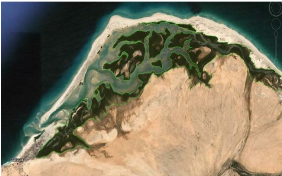
Google Earth image showing location of Mangrove forest in Caluula district.