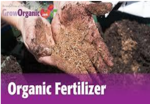
Lafa daqiiq ah

Lafaha kalluunku waa bacrimin organic ah, taas oo micnaheedu tahay in asalkoodu ka yimaadeen waxyaalo nool. Bacriminta organikada ah waxaa la xaqiiyey oo la ogaaday in aysan saameyn-dhibaato ku lahayn deegaanka, halka bacriminta Chemicalka ah ay dhibaato ku keeni karto deegaanka (beeraha). (2)